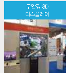
무안경 3D 디스플레이