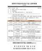
'18. 05. 23 제25회 멀티미디어기술대상 환경시장상