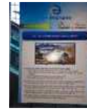
'17. 12. 05 다시점 디스플레이 모바일기술대상