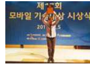
'17. 12. 05 다시점 디스플레이 모바일기술대상_2