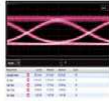
측정 조건 : DC : 100mA, -3.1V, 25°C RF : 32G, PRBS 2 31 -1, 3.5Vpp