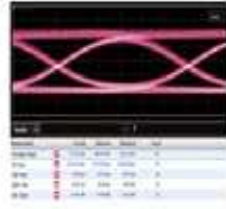
측정 조건 : DC : 120mA, -2.8V, 37°C RF : 25G, PRBS 2 31 -1, 2.2Vpp