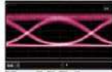
측정 조건 : DC : 100mA, -3.1V, 25°C RF : 28G, PRBS 2 31 -1, 3.5Vpp